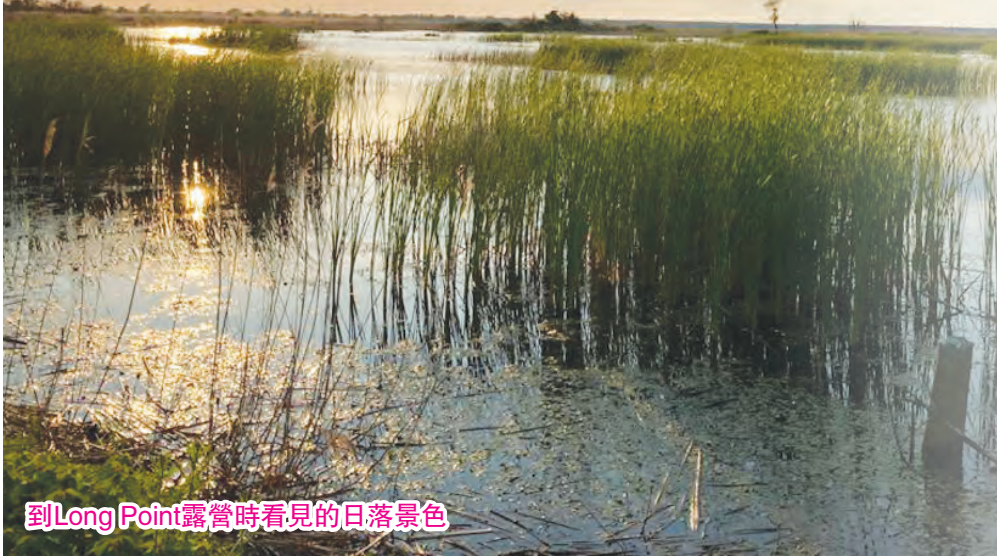
到Long Point露營時看見的日落景色