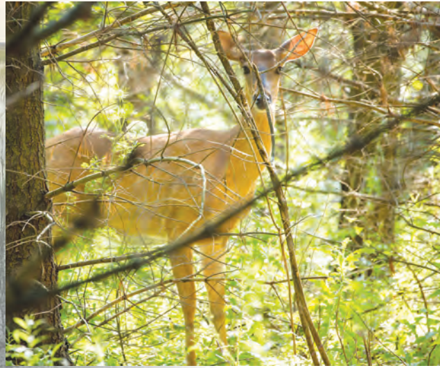
在Lyndeshore郊野公園遇見鹿