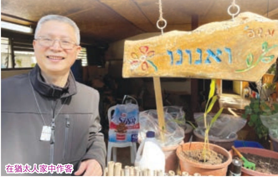
在猶太人家中作客