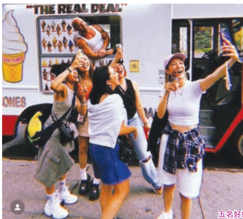
五名好姊妹開心合照