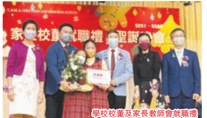
學校校董及家長教師會就職禮

故此，今年當兒子5歲適合升讀幼稚園時，我們便開始在家附近搜集有關基督教學校的資料。一天得悉某間教會學校當晚舉行一個簡介會，於是在沒有報名的情況下，便參與了當晚的活動，也索取了新生報名表。當知道幼稚級新生學額不多時，我們便懇切地為兒子報讀幼稚園一事禱告，也把我們的經濟狀況交託神，深信祂會供應。報名表預