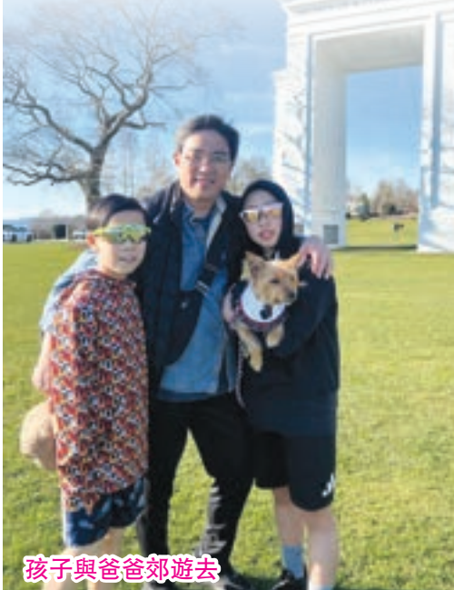
孩子與爸爸郊遊去