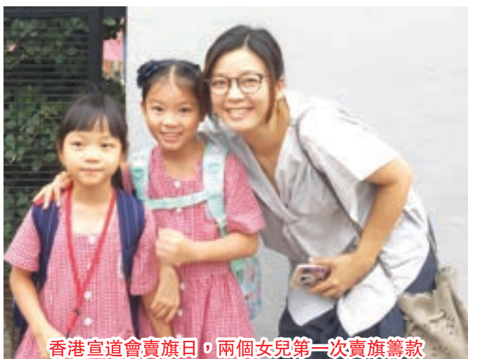
香港宣道會賣旗日，兩個女兒第一次賣旗籌款