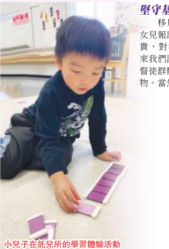
小兒子在託兒所的學習體驗活動

求主引領孩子走當行的道，到老也不偏離，阿們！☺ 請上號角網站www.heraldmonthly.ca收聽本文聆聽版音頻。