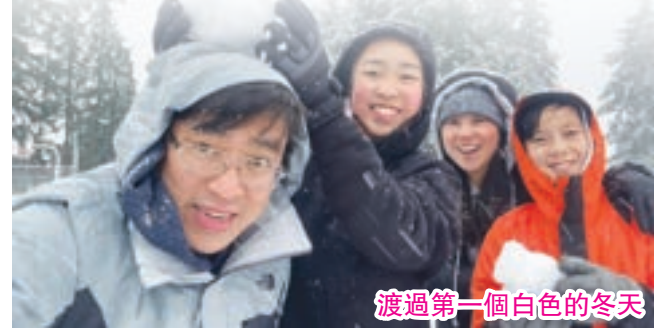
渡過第一個白色的冬天