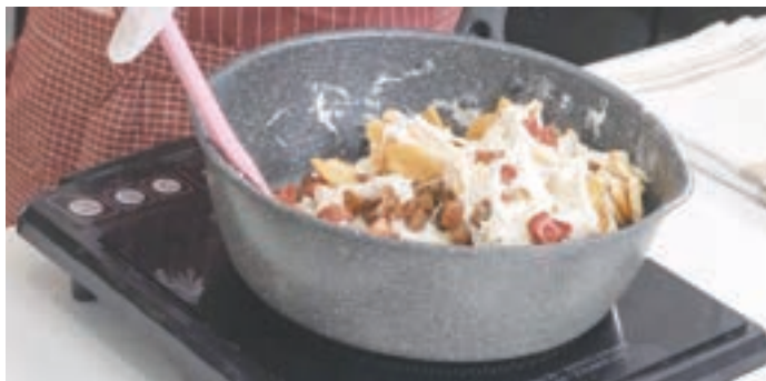
d) 加入紅莓和果仁攪拌