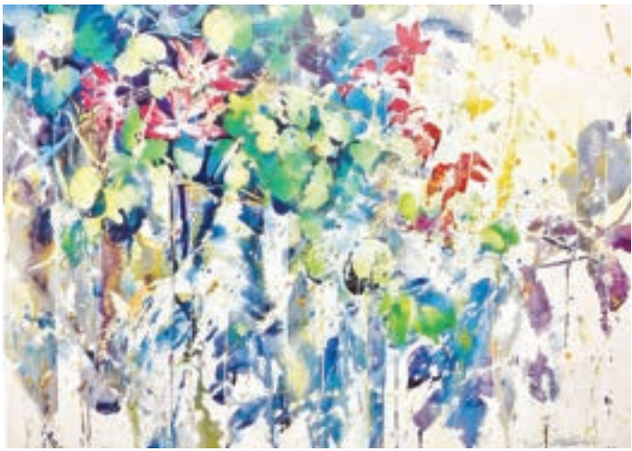
1991年 紫荊 (一)

加多利亞蘭是洋蘭中的女王，代表敬愛、傾慕；花朵大，花型飽滿，色彩艷麗。我用留白膠，飛擦出舞動筆觸，將蘭花開心快樂、雙雙起舞的情景表現出來。