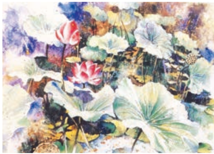
1997年 荷 (五)

紅杜鵑花代表熱情積極，白杜鵑花有清新脫俗和品德高尚之意。杜鵑花瓣造型變化豐富，紅白花朵互相輝映，配合得宜，實在驚嘆神造物的奇妙！