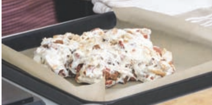
e) 煮好的糖倒在烘焙紙上