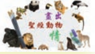
陳鈞陶 (Pottery Chan)