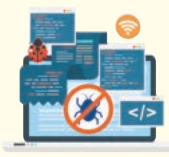
騙徒在受害人的電腦或網絡中偷取數據