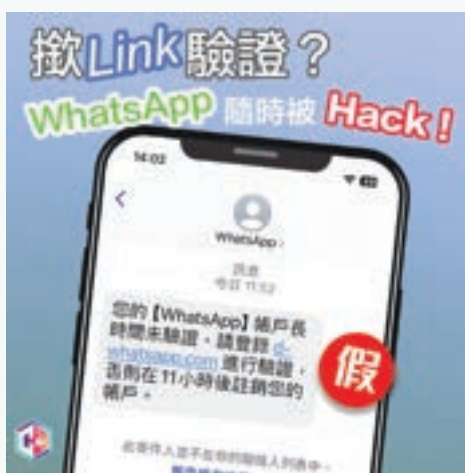
小心自稱WhatsApp客服傳來的驗證訊息 (fb@守網者)