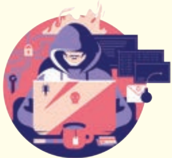
騙徒識別及研究目標