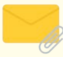
受害者開啓含惡意軟件的電郵