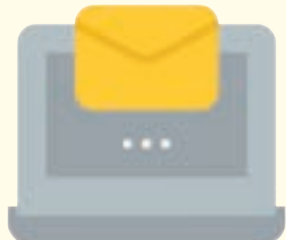
騙徒發送有針對性，但看似合法的電郵