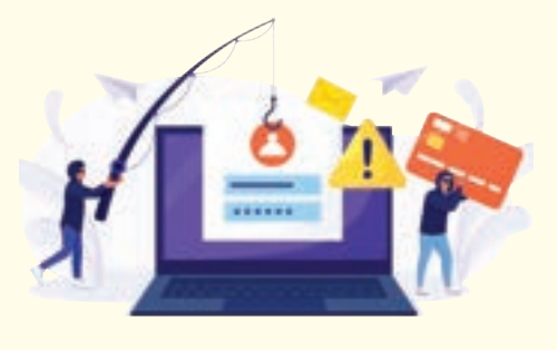
騙徒利用受害人電腦發放假電郵給聯絡名單上的人騙取金錢