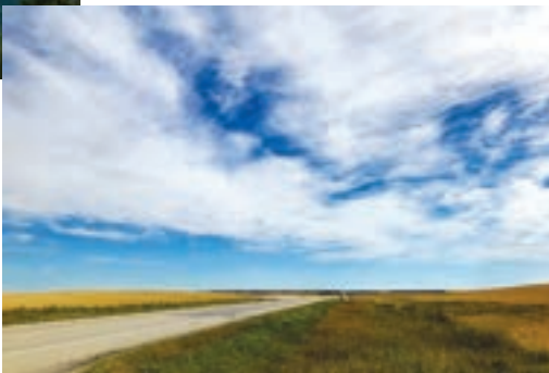
包先生來自中國內蒙古，他駕車橫越加拿大，目的就是來看看加拿大的草原。