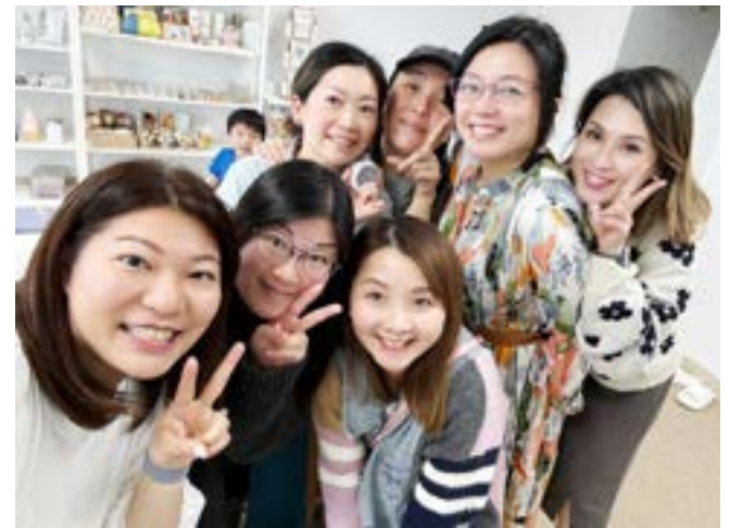
在溫哥華因手作而認識的朋友