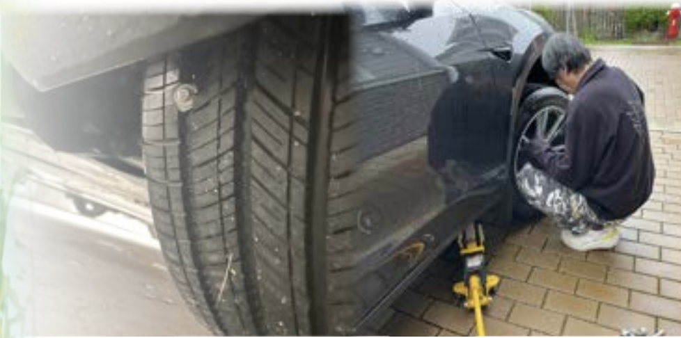
新車落地不到兩星期中釘