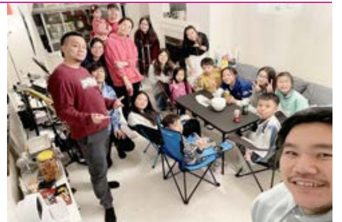
同行的朋友實在可貴

此刻我深信神必安排同路人在我們身邊，與我們一起並肩面對不同的挑戰和困難。《聖經·箴言》17章17節：「朋友乃時常親愛，弟兄為患難而生。」