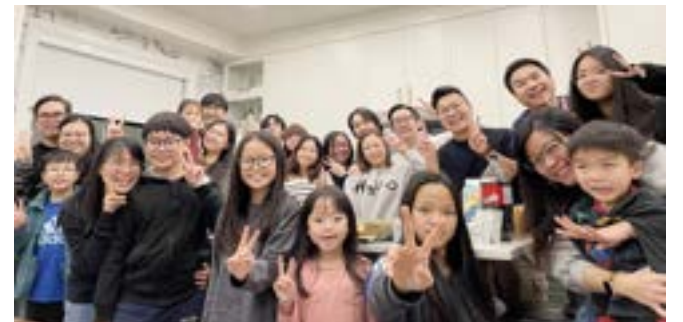
香港母會的弟兄姊妹在溫哥華相聚