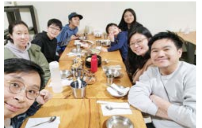
與大女幼稚園同學一家相聚溫哥華