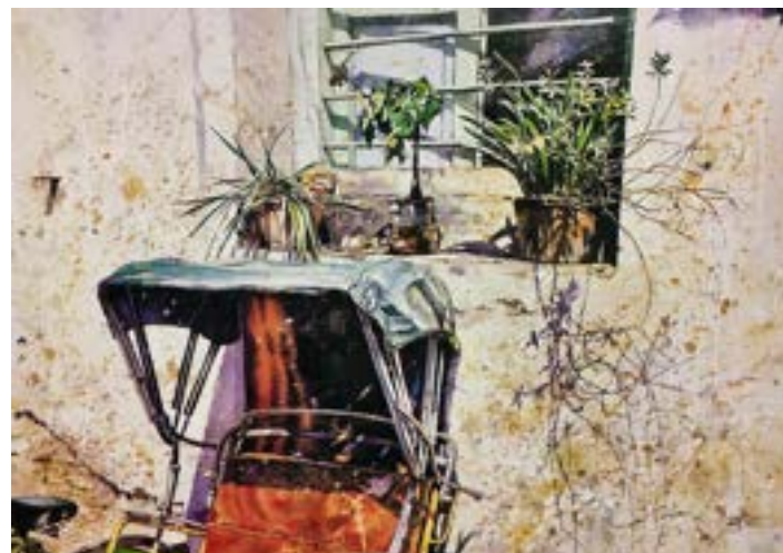
1993年 馬六甲風情 (一) 三輪車

在吉隆坡街頭看到一所房子外牆，懸掛晾著純樸的衣物，享受著陽光的洗禮，衣物色彩鮮明，擺放得十分自然，層次分明。我以留白膠、高亮度調子表現牆壁質感和表現早上陽光，深色的影子造成明暗對比，令衣物更為突出。