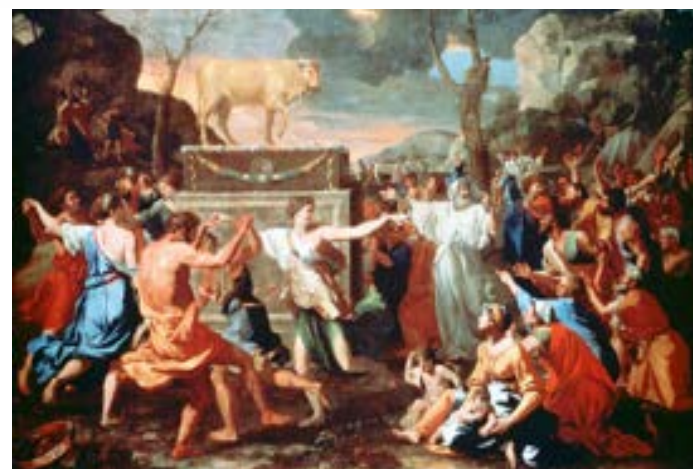
亞倫在何烈山造了金牛犢