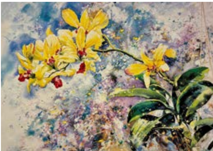
1992年 花夢 (五)

1989年初到馬來西亞，畫友開車上雲頂遊，途中看到這特別情景，兩塊背光的巨石，當中有一枝葉由上垂下，從巨石向外望，看見藍天白雲，感覺別有洞天。我以渲染彈灑，表現石頭的肌理和那通透翠綠的枝葉，形成強烈的質感和空間對比，結構之美，實在驚嘆造物主的奇妙創造！