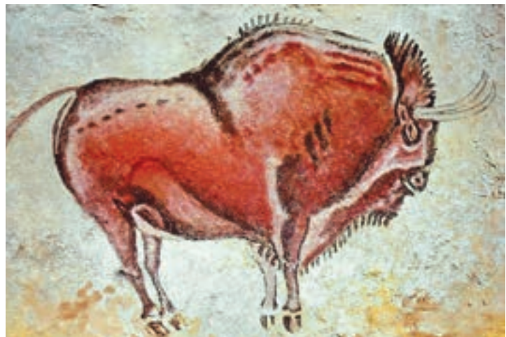
古代西班牙石壁野牛

最早被發現的野牛壁畫，位於西班牙北部阿爾塔米拉洞穴裡，是公元前一萬二千年的作品，乃是野人出去打獵，把所見所聞包括野牛、鹿和其他動物畫在石壁上，供妻兒欣賞，這可能是最遠古的貼文。該處現已建立了一座展覽館，