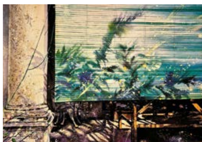
1993年 馬六甲風情 (二) 綠色簾

路經馬六甲街頭的一所房子，屋前停泊著一部三輪車，後面的窗台擺放著一些小盆栽，中午的陽光照耀著破舊的泥土牆，正是車夫辛勞了半天，午飯後休息的時候，也帶出熱帶風情。