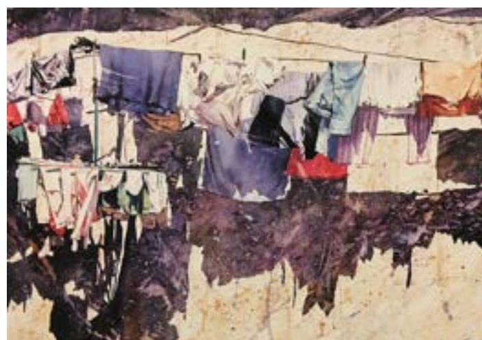
1993年 齊來享受陽光 (二)

從麻坡開車到馬六甲途中，途經西瓜市場，看到一籮籮西瓜放在地上，即時拍了幾幅不同角度的照片。當時陽光照著西瓜，同時令竹籮產生了戲劇性的光影效果，非常吸引、悅目。