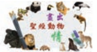
陳鈞陶 (Pottery Chan)