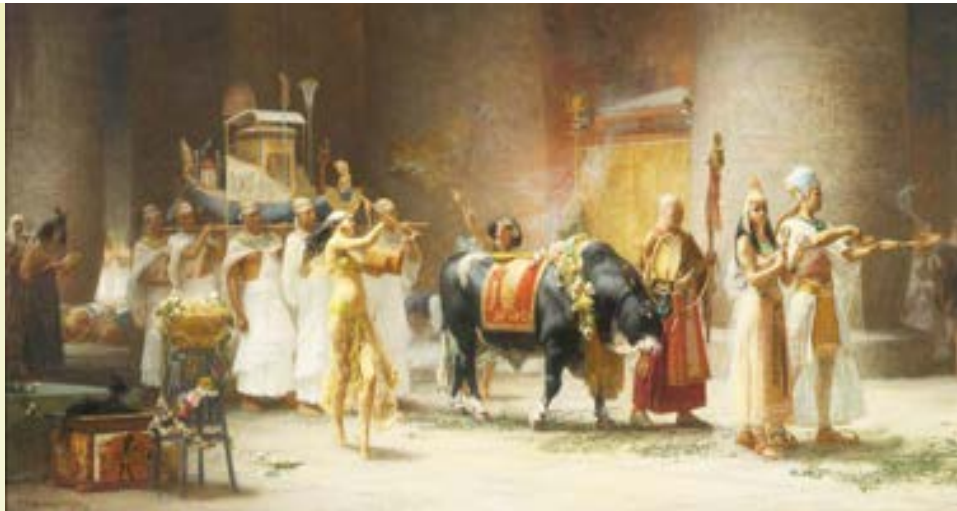
埃及人拜牛神亞皮斯