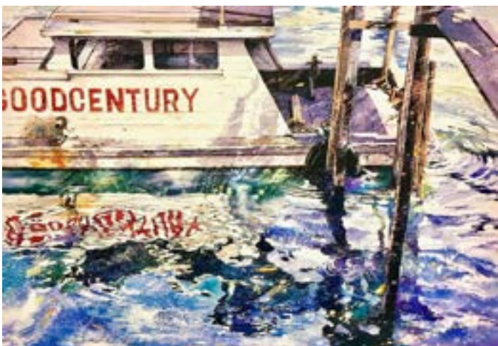
1993年 倒影 (三)

沙田馬場彭福公園內種了多株棕櫚樹，很有大馬風情，女兒在樹叢中遊戲，一幅美麗的圖畫展現眼前，就是這樣創作了這幅《棕櫚》。