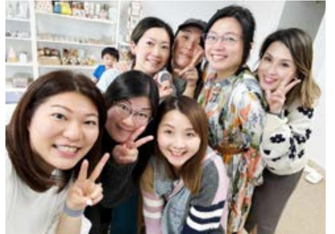
在溫哥華因手作而認識的朋友