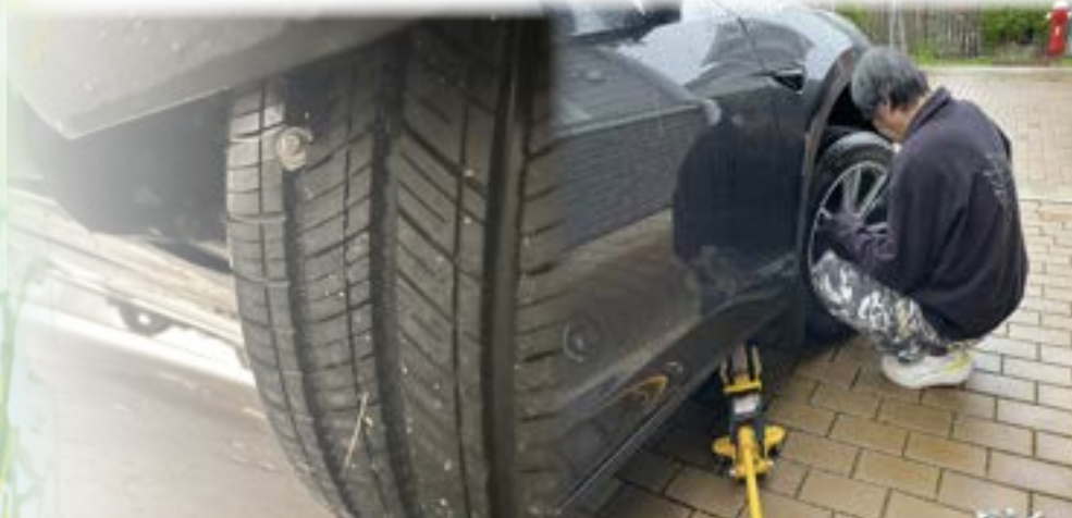
新車落地不到兩星期中釘