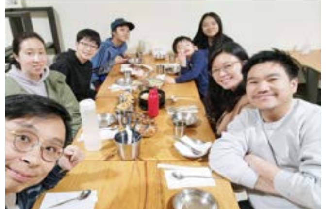
與大女幼稚園同學一家相聚溫哥華