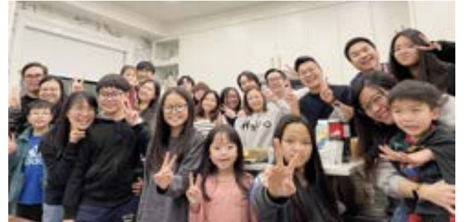
香港母會的弟兄姊妹在溫哥華相聚