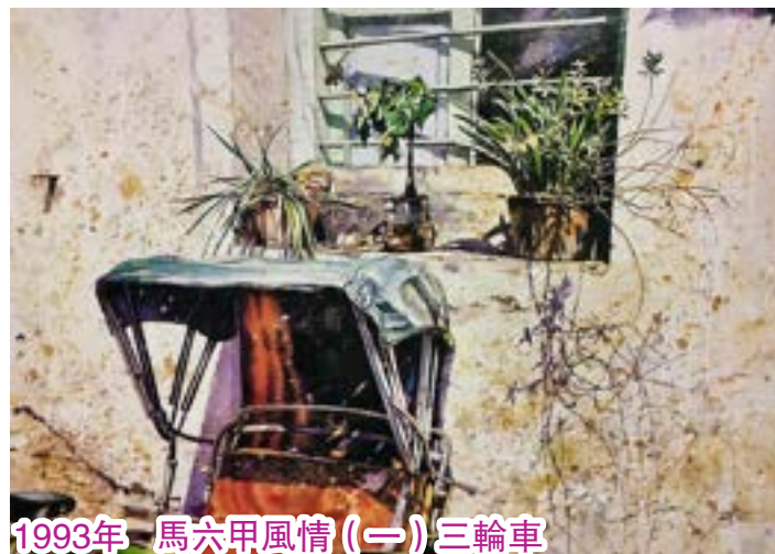
1993年 馬六甲風情(一) 三輪車

那天在馬六甲遊，河上船隻和藍天白雲的倒影，色彩異常明艷，與馬來西亞人的熱情非常吻合。倒影同時反映當地文化，啟發我日後創作重要的《倒影》系列。