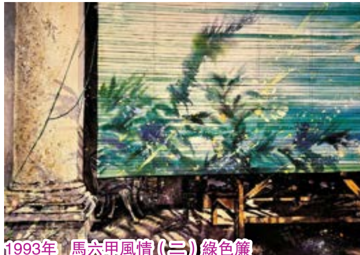
1993年 馬六甲風情(三) 綠色簾

從麻坡開車到馬六甲途中，途經西瓜市場，看到一籮籮西瓜放在地上，即時拍了幾幅不同角度的照片。當時陽光照著西瓜，同時令竹籮產生了戲劇性的光影效果，非常吸引、悅目。