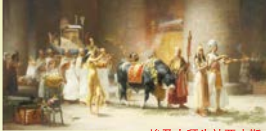
埃及人拜牛神亞皮斯

壇，按以色列十二支派，立十二根柱子，並打發以色列人中的少年人去獻燔祭，又向耶和華獻牛為平安祭。所以，作為領袖之一的亞倫理應不會這樣糊塗，以牛犢當為敬拜的對象。在金牛犢事件以後，摩西曾透露耶和華向亞倫發怒，要滅絕他，摩西懇切為他禱告，但之後《出埃及記》再也沒有神直接責備亞倫的記錄。