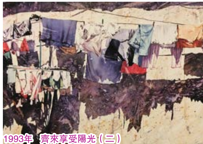
1993年 齊來享受陽光(三)

1992年再到大馬，畫友邀請我們一家三口到他在麻坡的家小住，平房小屋，十分清雅。他在家居後園種植不同品種的蘭花。我選畫了其中一棵，以紫藍色調子渲染，用留白膠、灑鹽和噴水，繪出喜樂動感背景，這蘭花的形態充滿活力，黃色花朵和背景顏色互相比對，令蘭花更顯突出和舞動感。