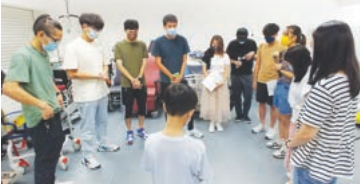
微電影煞科日以禱告呈獻給主

在香港工作時，我曾經與教會合作，統籌拍攝輯福音微電影；於我而言，一切由零開始，在資源、財政、時間、人力都緊絀下，再加上疫情限制，由構思劇本、物色演員、拍攝場景、預備服裝道具、與演員對稿、採排……也要親力親為，參與其中；但這一切限制，無阻我們團隊上下一心，並肩作戰，更不惜捱更抵夜；在拍罷煞科戲那一刻如釋重負，但能同心完成一件艱巨的工作，實在令人興奮莫名，感動不已。能在所做的事情上，尋找到當中的意義和價值，然後持定目標，排除萬難，堅持不懈，縱然艱難，那份滿足感，絕對令我們覺得物超所值。