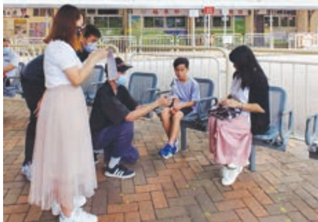
小兒子飾演主角童年