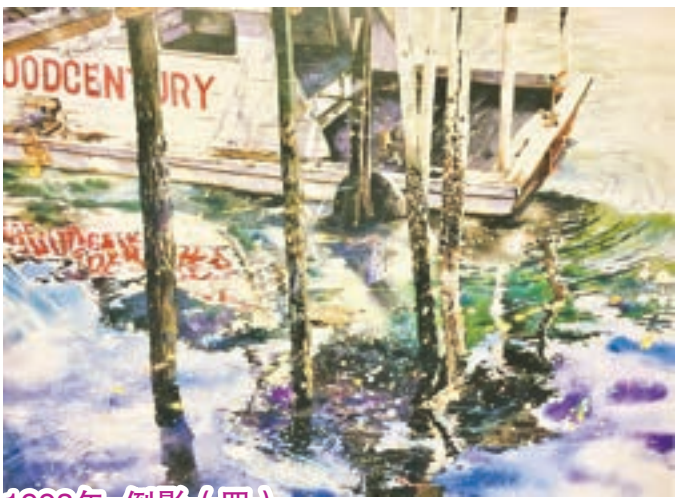
1993年 倒影 (四)

當年創作了兩張巨幅「倒影七、八」，描寫銅鑼灣避風塘艇戶的情景。這幅藍白色帆布倒影帶出了一點香港情懷。巨幅「倒影」在水分控制方面亦有一定難度，十分有挑戰性。