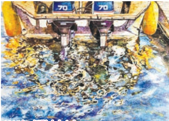
1995年 倒影 (十六)

這幅倒影作品中的船隻非常有特色，船身印有速遞公司的商標，而船隻看起來十分殘舊，可以理解當地民生頗為貧困；但船的外形卻非常入畫，線條有些古典美感。