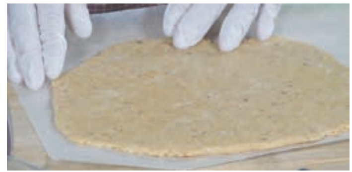
g) 壓平冷卻的椰子糖