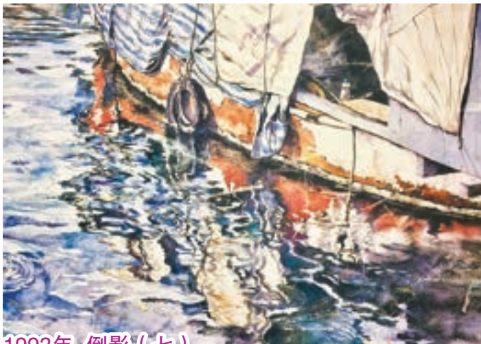
1993年 倒影 (七)

在香港仔鴨洲海邊，看到漁船的倒影，每秒不斷變化著，每一刻都是奇妙的藝術傑作。我試用留白膠造出像魚群跳躍水面的感覺，但造物主的創作才是最完美。