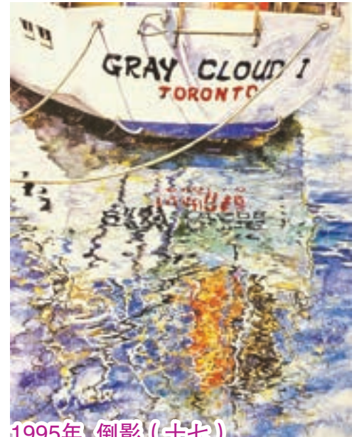
1995年 倒影 (十七)

抵步多倫多翌年，提交5幅「倒影」原作，成功被接納為「加拿大水彩畫家協會」CSPWC署名會員，這幅作品同時被加拿大Diploma Collection 永久收藏。