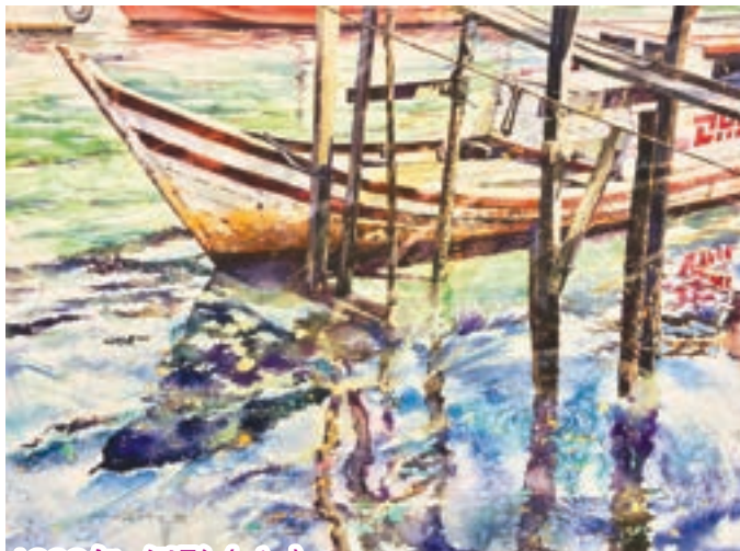
1993年 倒影 (六)

這幅倒影作品中的船隻非常有特色，船身印有速遞公司的商標，而船隻看起來十分殘舊，可以理解當地民生頗為貧困；但船的外形卻非常入畫，線條有些古典美感。