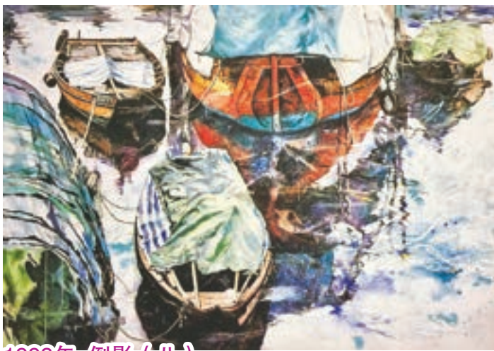
1993年 倒影 (八)

馬六甲河上的船隻很有特色，船身和藍天的倒影顏色十分濃，可能和晴朗炎熱天氣有關，亦很配合大馬人民的熱情。