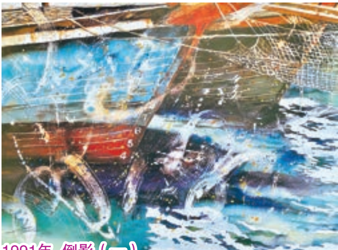
1991年 倒影 (一)

在香港仔鴨洲海邊，看到漁船的倒影，每秒不斷變化著，每一刻都是奇妙的藝術傑作。我試用留白膠造出像魚群跳躍水面的感覺，但造物主的創作才是最完美。