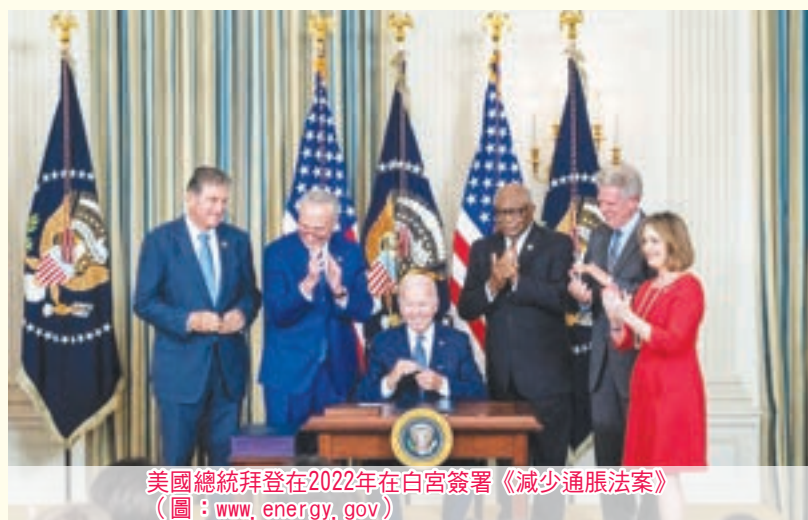
美國總統拜登在2022年在白宮簽署《減少通脹法案》

另一方面，假如特朗普再次當選，在能源政策上他主張自行開發和提煉石油，這對加拿大向美國出口石油不無影響。