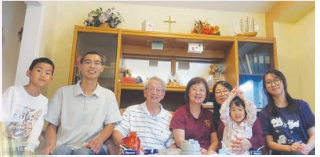
全家感受愛的關顧

2022年底疫情剛過，我們迫不及待從溫尼伯遷往多倫多，想盡快安頓下來，然後專心修讀神學；然而，在前往多倫多的路上，我們乘坐的汽車遇上了嚴重的車禍。12月27日下午約4時許，當時天色昏暗，從早上開車的丈夫已經非常疲憊，但仍然焦急地趕路，導致他在不熟悉地形的情況下超車，就在那一刻對面快速駛來一輛車，情急之下我們的車直衝向路邊的雪地裡，四輪朝天，一家人被困車中，安全帶緊緊地勒著脖子，動彈