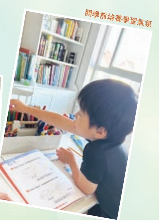
開學前培養學習氣氛