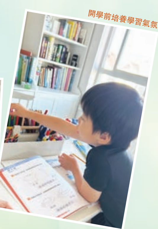
開學前培養學習氣氛