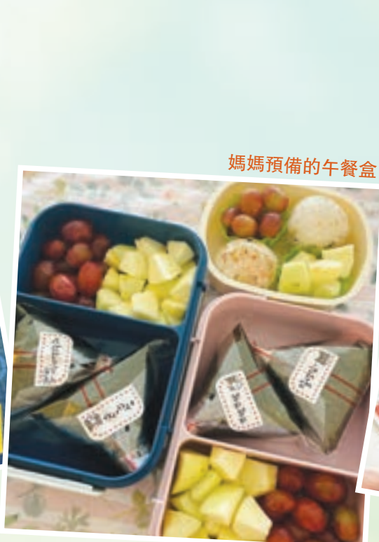
媽媽預備的午餐盒