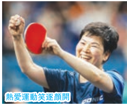
熱愛運動笑逐顏開

運動員排除萬難，晉身這國際盛事，必定背負著不同人的期望，面對著各種重擔和輿論聲音，應該如何自處？在游泳個人賽中獲得兩面銅牌的何詩蓓大方地回應：「我很享受這次比賽，我的目標是在比賽中發揮水準，過程比結果更重要；過去三年我已盡了努力，在比賽中表現出最好的狀態，已經沒有遺憾了！」她沒有背負別人的期望，只朝著與教練定下的計劃及目標，盡心竭力完成任務，最重要是享受比賽的過程。