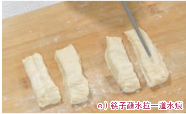
e) 筷子蘸水拉一道水痕