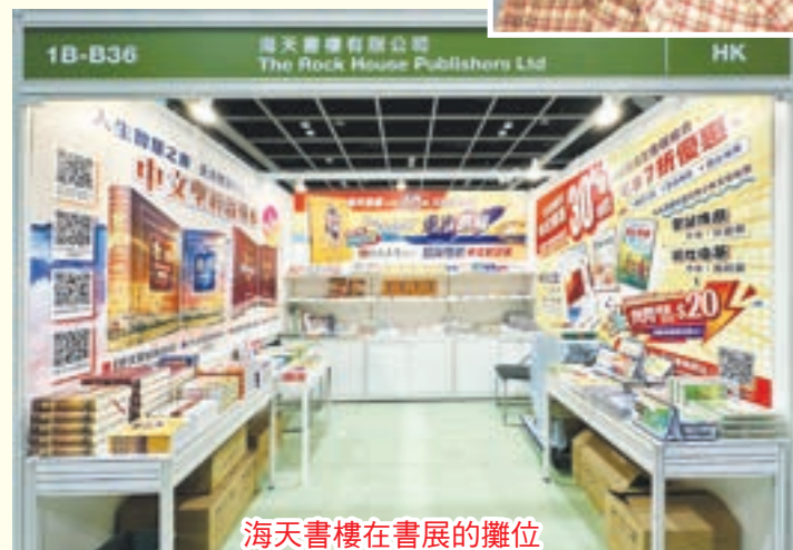
海天書樓在書展的攤位

神的國度是無界限的，所有信徒都是一家人。為甚麼繁體和簡體不能合而為一呢？出版《重審耶穌》「繁簡雙體中文對讀版」，就是要讓繁簡中文融匯在一起，這本好書的內頁設計為上半頁印繁體字 (白色底)，下半頁印簡體字 (淺網底)，書頁左方中間也有繁簡提示，便於對讀和辨別不同的字體，幫助讀者了解和尊重其他華人地區的文化 and 語言差異，促進溝通和理解。