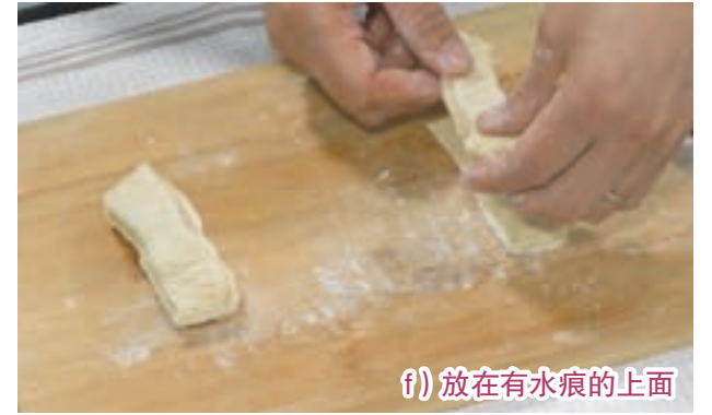
f) 放在有水痕的上面