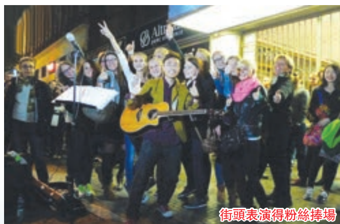
街頭表演得粉絲捧場

還有樂迷的支持，已感到無比幸福。請上號角網站 www.heraldmonthly.ca 收聽本文聆聽版音頻。