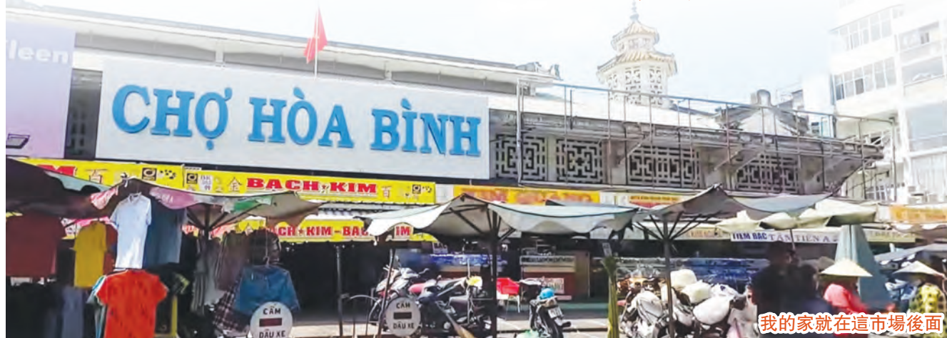
我的家就在這市場後面

「一切都是出於神，他藉著基督使我們與祂和好，又將勸人與祂和好的職分賜給我們。」（哥林多後書5章18節）