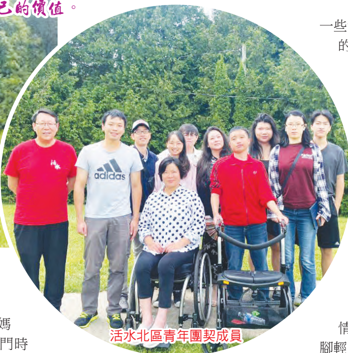
活水北區青年團契成員