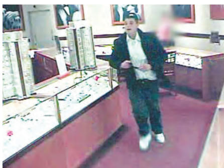
約克區警方正追捕圖中男子，他與8宗由大多市至巴里市發生的珠寶店劫案有關，其中4宗發生於約克區。

2024年1月至5月：除了砸碎玻璃強搶珠寶外，2024年上半年更出現詭計稱買鑽戒，然後強搶逃逸的犯案手法，由1月至5月期間，大多市一連8間珠寶店因此蒙受損失。這名據警方形容為貌似中東人的男子，約20至30歲，在8間店舖犯案的手法相似：每次走入珠寶店內，他都要看一萬元價位的訂婚戒指，當他拿起戒指佯裝比較時，轉身便飛跑離開珠寶店。8間遇劫的店舖中，有6間是People's Jewellers，分別位於大多市周邊的購物商場。