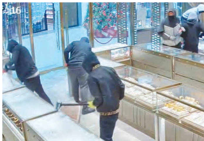
打碎玻璃門後，賊人闖入周大福珠寶店搶掠珠寶。

2024年9月8日 ：8名疑犯涉嫌搶劫密西沙加一間珠寶店，部分持有槍械；及至10月29日，兩名分別為14及15歲的青少年涉嫌參與搶劫被捕。