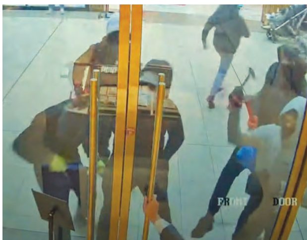
2024年12月16日6名男子以鐵鎚打碎周大福珠寶店的玻璃門。

2024年12月16日 ：Fairview Mall 周大福珠寶店被6名劫匪闖入。